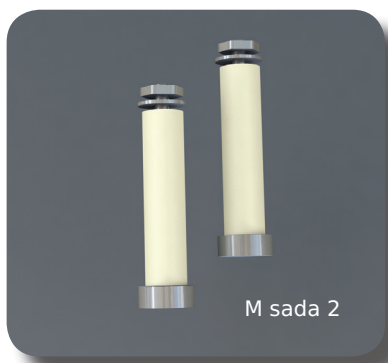
M sada 2

Tento modul lze také za pomoci montážní magnetické sady namontovat do libovolného svítidla s plechovou monturou. Díky magnetickému uchycení o síle cca 2 kg, je jeho použití univerzální.